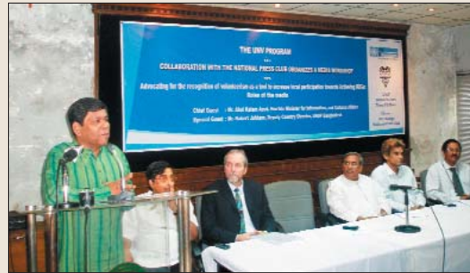
সেমিনারের সভাপতি বক্তব্য রাখছেন