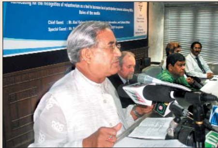
মাননীয় মন্ত্রী বক্তব্য রাখছেন