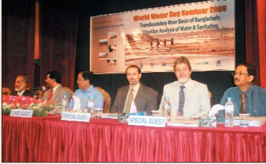
মাননীয় প্রতিমন্ত্রীর সেমিনারে উপস্থিত অতিথিবৃন্দ