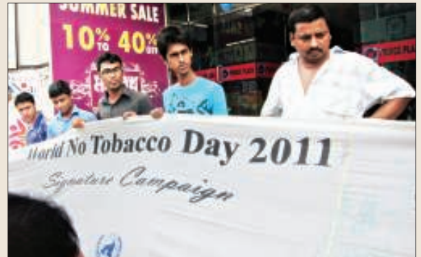
অভিযানে অংশগ্রহণকারীদের একাংশ