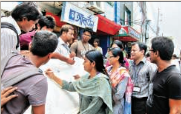
ছাত্রছাত্রীরা তামাকের বিরুদ্ধে 'না' সূচক বক্তব্য লিখছেন