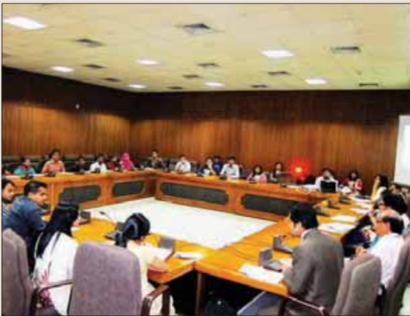
গোলটেবিল আলোচনায় অংশগ্রহণকারীবৃন্দ