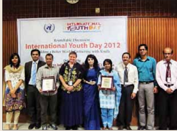
এভারেস্ট বিজয়ী ও অতিথিদের গ্রুপ ছবি