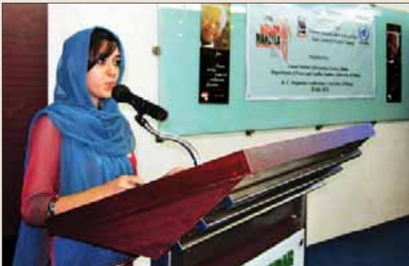
একজন যুব প্রতিনিধি বক্তব্য রাখছেন