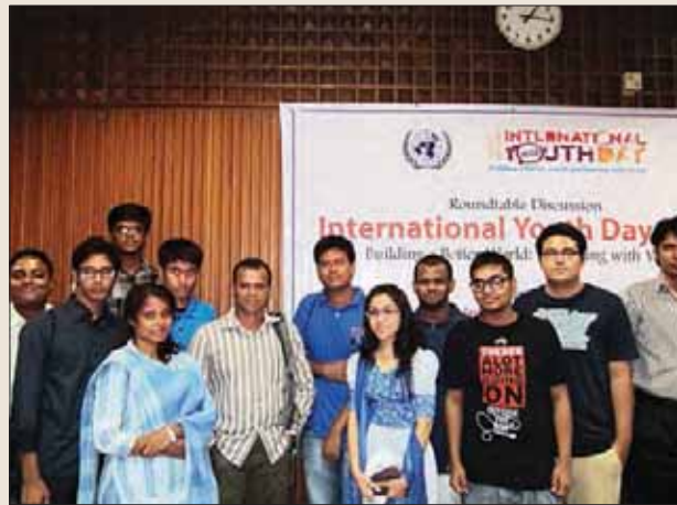
যুব প্রতিনিধিদের সাথে এভারেস্ট বিজয়ীদ্বয়