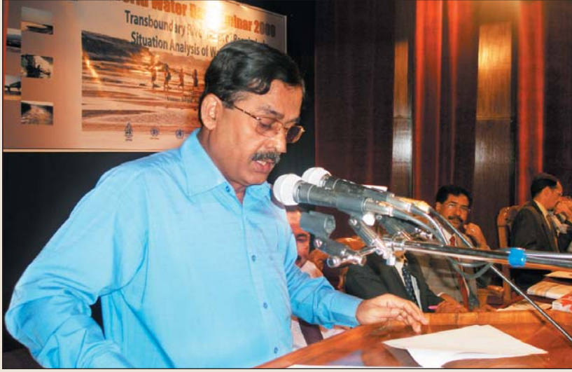
পানি দিবসের সেমিনারে প্রবন্ধ উপস্থাপন করছেন স্থানীয় সরকার, পল-ী উন্নয়ন ও সমবায় মন্ত্রণালয়ের মাননীয় প্রতিমন্ত্রী জনাব জাহাঙ্গীর কবীর নানক