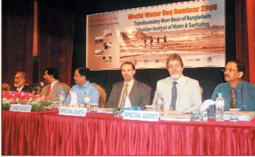
মাননীয় প্রতিমন্ত্রীর সেমিনারে উপস্থিত অতিথিবৃন্দ