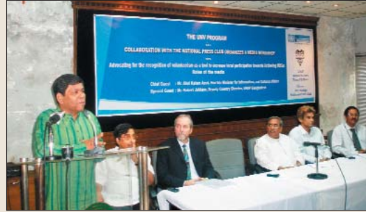
সেমিনারের সভাপতি বক্তব্য রাখছেন