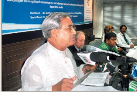
মাননীয় মন্ত্রী বক্তব্য রাখছেন