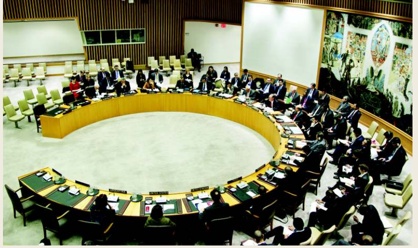
আইনের শাসনের উন্নয়ন বিষয়ে জাতিসংঘ নিরাপত্তা পরিষদের সভা

বিশ্বব্যাংকের ২০১১ সালের বিশ্ব উন্নয়ন রিপোর্টে নিরাপত্তা, ন্যায়বিচার ও কাজের মতো ক্ষেত্রগুলোতে ভঙ্গুরতার চক্র ছিন্ন করার জন্য পরস্পর সম্পর্কযুক্ত এই তিনটি বিষয়ই যে প্রধান তার বাস্তব প্রমাণসহ ধারণাটি তুলে ধরা হয়েছে। এর প্রতিটিই আইনের শাসনের মাধ্যমে জোরদার করা যেতে পারে। সংঘাত বিধ্বস্ত এলাকায়, যেখানে ব্যাপক আলাপ-আলোচনা নির্ভর অন্তর্বর্তীকালীন বিচার ব্যবস্থা নিরাপত্তাকে স্থিতিশীল করে সেখানে