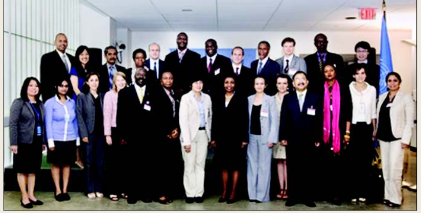
জাতিসংঘের সাবেক ডেপুটি সেক্রেটারি জেনারেল আশা রোজ ম্যারি মিগিরো আইনের শাসন বিষয়ক একটি ওয়ার্কশপে অংশগ্রহণ করছেন (ডান দিক থেকে সপ্তম)

আইনের শাসনে সহায়তাদানে জাতিসংঘ আদর্শিকভাবে একটা অবস্থানে থাকার কারণে তা যখন সমন্বয় করতে যায়, তখন