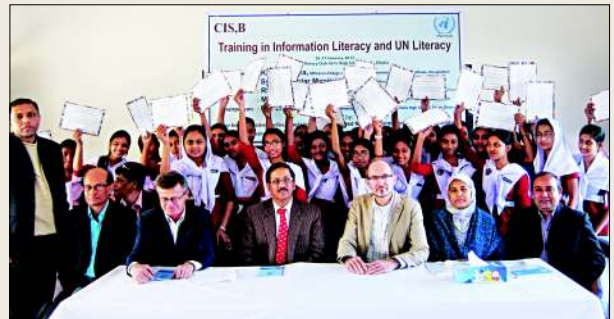
সার্টিফিকেট হাতে প্রশিক্ষার্থী ও মঞ্চ উপবিষ্ট আমন্ত্রিত অতিথিবৃন্দ

জাতিসংঘ তথ্য কেন্দ্র, ঢাকা কর্তৃক ইউএন হাউজ, আইডিবি ভবন, বেগম রোকেয়া সরণী, শের-ই-বাংলানগর, ঢাকা থেকে প্রকাশিত মাসিক সংবাদ বুলেটিন : নির্বাহী সম্পাদক : কাজী আলী রেজা, ফোন : ৯১৮ ৩০৮৬, ফ্যাক্স : ৯১৮৩১০৬ ওয়েব : www.unicdhaka.org